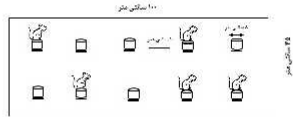
شکل ۲- تکنیک سکوی چندگانه برای القاء محرومیت از خواب

آن: اهمیت بیولوژیکی خواب کافی زمانی آشکار می‌شود که فرد دچار اختلالات فیزیولوژیکی و سایکولوژیکی در ارتباط با محرومیت از خواب شود. زنان بیشتر از مردان اختلالات خواب را تجربه می‌کنند و بیشتر این اختلالات در ارتباط با سیکل جنسی اتفاق می‌افتد. به خاطر اینکه زنان تغییرات هورمونی زیادی را در طول مدت سیکل جنسی به‌خصوص در دوران بلوغ، چرخه قاعدگی، حاملگی و یائسگی تجربه می‌کنند. اینگونه فرض می‌شود که مکانیسم‌های کنترلی خواب نرمال در زنان ممکن است بوسیله استروئیدهای جنسی موجود در گردش خون تحت تأثیر قرار بگیرد [۷۳-۷۴]. هورمون‌های جنسی (تستوسترون در مردان و استروژن‌ها و پروژستین‌ها در زنان) در تعدیل رفتارهای در ارتباط با خواب نقش دارد. مطالعه کوهورت در مردان ۶۵ سال و بالاتر نشان داده