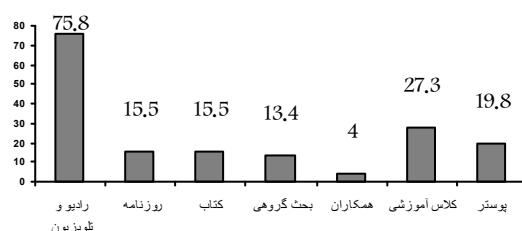
نمودار شماره ۲ - توزیع فراوانی نسبی منابع کسب اطلاعات دانشجویان در خصوص بیماری ایدز