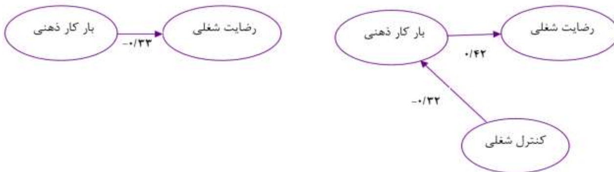
شکل ۱. مدل ترسیمی ارتباط بین متغیرهای رضایت شغلی و بار کار ذهنی بدون وجود متغیر تعدیل‌کننده کنترل شغلی و با وجود آن

استاندارد بین دو متغیر بار کاری و رضایت شغلی ( P < 0.001 )، r = -0.42 و ضریب استاندارد متغیر کنترل شغلی بر متغیر بار کاری ( P < 0.001 )، r = -0.32 است. به بیانی دیگر با وجود متغیر کنترل شغلی، که ارتباط معنادار و معکوسی با متغیر بار کاری دارد، ارتباط دو متغیر بار کاری و رضایت شغلی مقداری افزایش یافته است.