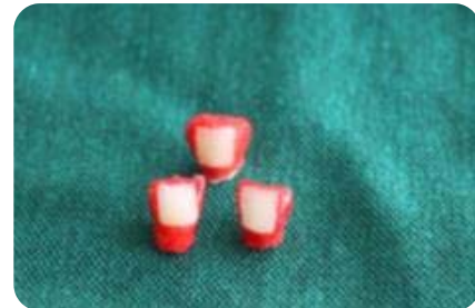
شکل ۱- آماده سازی پنجره‌ای به ابعاد ۰/۴×۰/۴ سانتی‌متر در سطح باکال دندان‌ها

در آب مقطر و در دمای اتاق نگهداری شدند. جهت آماده‌سازی نمونه‌ها، تاج و ریشه دندان از ناحیه C.E.J قطع شده، بقایای پالپ و محتوای باقیمانده در اتاقک پالپ به طور کامل تخلیه شد. سپس اتاقک پالپ با کامپوزیت پر گردید. در سطح باکال دندان‌های آماده شده پنجره‌ای به ابعاد ۰/۴×۰/۴ سانتی‌متر با برچسب کاغذی گذاشته شده، اطراف برچسب با لاک ناخن پوشانده شد. سپس برچسب برداشته شده، اضافات چسب با گاز و آب شسته شد (شکل ۱).