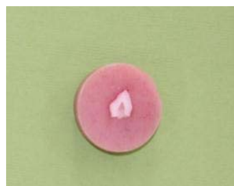
شکل ۲- نمای دندان برش خورده و آکريل گذاري شده پس از پاليش

مواد معدنی مینا و عاج را نشان می‌دهد، این آزمون برای ارزیابی تغییرات سطح دندان انتخاب شد. برای تعیین میکروهاردنس، سطح دندان در ناحیه پنجره به صورت عمودی به دو قسمت تقسیم گردید. قطعه به دست آمده به گونه‌ای داخل آکريل قرار گرفت که کل سطح دندان به جز ناحیه برش خورده پوشانده شود. نمونه‌های آماده شده با دیسک‌های کاغذی ساییده (۸۰۰، ۱۲۰۰، ۶۰۰ grit) پالیش شدند. پالیش نهایی با استفاده از محلول حاوی ذرات آلومینیوم اکساید ۰/۰۳ Mm و ۰/۵ Mm بر روی پارچه‌های مخصوص انجام شد (شکل ۲).