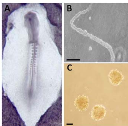
شکل ۱: تصویر میکروسکوپ فاز کنتراست از جنین جوجه در مرحله ۱۰ سوماتیتی (A) و نوتوکورد (B) و سوماتیت‌های جدا شده از این جنین (C). Bar= 100 μm.

بعد از استخراج جنین جوجه در مراحل ۱۰ تا ۱۲ سوماتیتی از سطح زرده (شکل ۱A) و جداسازی نوتوکورد (شکل ۱B) و سوماتیت از آن (شکل ۱C)، سوماتیت‌ها در ظروف حاوی محیط کشت قرار داده شدند (شکل ۲A). بررسی‌های مورفولوژیکی در گروه‌های مورد مطالعه نشان داد که سلول‌های سوماتیتی پس از دو روز کشت با نوتوکورد و نیز بدون حضور نوتوکورد از گوشه‌های سوماتیت شروع به رشد و تکثیر نموده (شکل E و ۲B) و پس از شش روز کشت توانستند به‌صورت سلول‌هایی با ظاهر سلول‌های مزانشیمی تمایز یابند؛ اگرچه تعداد این سلول‌ها در گروه بدون هم‌کشتی کمتر بود (شکل F و ۲C). از طرف دیگر، مطابق با شکل ۲D سلول‌های مزانشیمی از یک جسم سلولی